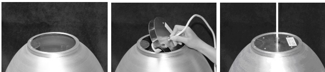
Einfügen des Leuchtmittelträgers in den Reflektor.