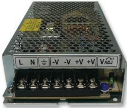
AC/DC-Einbaunetzteil TDK-Lambda LS-150-12

Es ergibt sich das biologisch neutralste Glühlampenlicht unter Vermeidung elektromagnetischer Störstrahlung und wie beim Sonnenlicht auch keinerlei Flimmerfrequenzen.